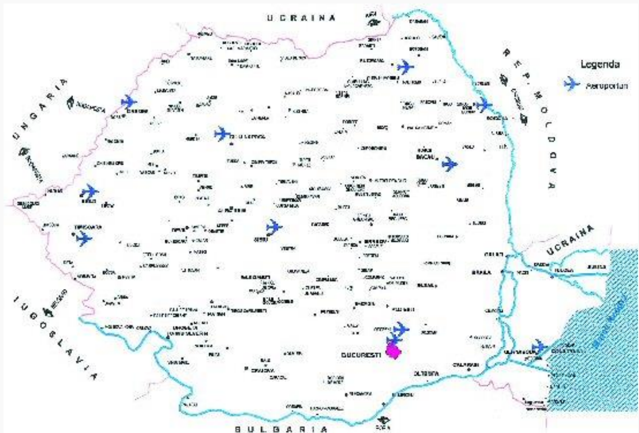
REȚEAUA DE AEROPORTURI